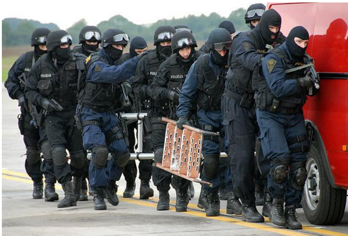
Zásahová jednotka správy Severomoravského kraje a zásahová jednotka z polských Katowic

Líbilo se mi tam, ale bylo tam hodně lidí.