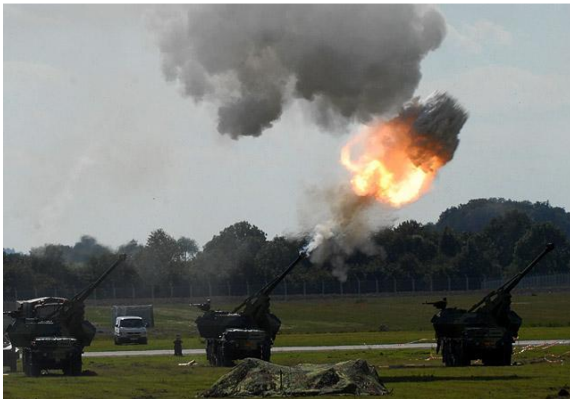
Dělostřelecká baterie Armády české republiky při odstřelování nepřátelského družstva