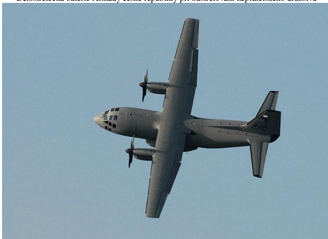
Španělské vojenské dopravní letadlo CASA-247 Honza