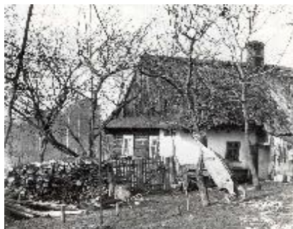
Kotulova dřevěnka před rekonstrukcí

Návštěvníci mohou sledovat mlecí zařízení v provozu.