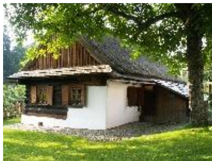
Kotulova dřevěnka dnes