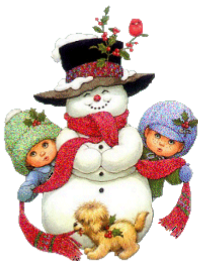
Kajka a Štěpa

První vánoční zboží a výzdoby se v USA objevují již s koncem léta. První vánoční vlaštovkou je 23. listopad (Den Děkuvzdání). Peče se krůta, popíjí se a pořádají se přátelská setkání. Dveře domů jsou otevřeny přátelům, sousedům a známým. Počínaje Dnem Děkuvzdání (podle tradice indiáni zachránili od smrti hladem evropské misionáře) se vánoční atmosféra rozjíždí naplno. V obchodech se objevují výrazné slevy, které lákají k nákupu dárků.