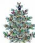
Piki a Pája

Zvyk stavět betlémy patřil tedy k nejrozšířenějšímu vánočnímu zvyku. Betlém byl symbolem vánoc, ale v 19. století byl postupně vytlačován vánočním stromkem, který se nakonec stal novým symbolem vánoc. Současné vánoční dění v českém betlémářství sleduje České sdružení přátel betlémů se sídlem v Hradci Králové a sedmnácti místními pobočkami a které pořádá výstavy betlémů.