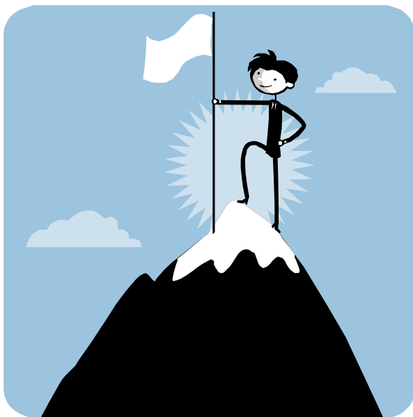
Domin a Vachta

Ráno jsme se vzbudili a o půl 9 byla snídaně. Po snídani jsme měli volno do 11 hodin na sbalení věcí. Po 11 jsme vyšli na hotel Petra Bezruče, kde byl bazén. Jak jsme se vykoupli, tak jsme se vydali do Frýdlantu nad Ostravicí, který byl vzdálený 6 km. Ve Frýdlantu jsme měli hodinový rozchod. Z Frýdlantu jsme jeli zpět do Frýdku-Místku. Z Frýdku jsme jeli zpátky domů, kde nás čekali naši rodiče. Doma jsme byli kolem 17:00. Výlet se nám líbil a doufáme, že jich bude víc.