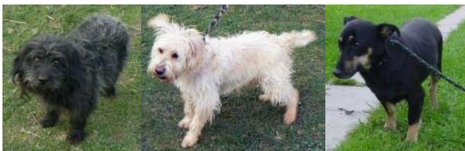
Náhodná nabídka pejsků z útulku v Sedlištích.