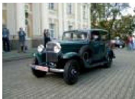
I takovéto nablýskané krasavce můžete vidět v