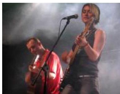
Lenka Dusilová Ostravě...

1.5. se můžete v Havířově na náměstí Republiky podívat na tradiční Májovou Slavnost. Ve Frýdku-Místku se celý měsíc bude konat výstava Makrofotografie-miniaturní svět přírody. V Ostravě od 3.5-6. 5. bude výstava Veteran car show (přehlídka starých vozů). Pokud máte rádi hvězdy, tak 5. 5. se ve Hvězdárně J. Palisy koná Hudba pod hvězdami. Máte radši divadelní hry? V Divadle A. Dvořáka se 19. 5. hraje hra Maryša, působivá hra bratrů Mrštíků. Milovníci Lenky Dusilové si přijdou na své 31. 5. v Ostravě, kdy pořádá koncert.