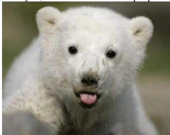
Medvídek Knut se stal doslova přes noc celebritou

Doufejme, že Knut bude dále žít a přizpůsobí se k svému instinktu.