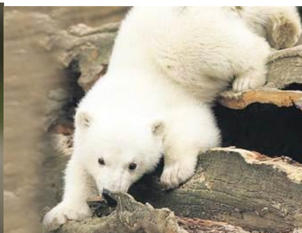
Knut neví, že se stal miláčkem veřejnosti