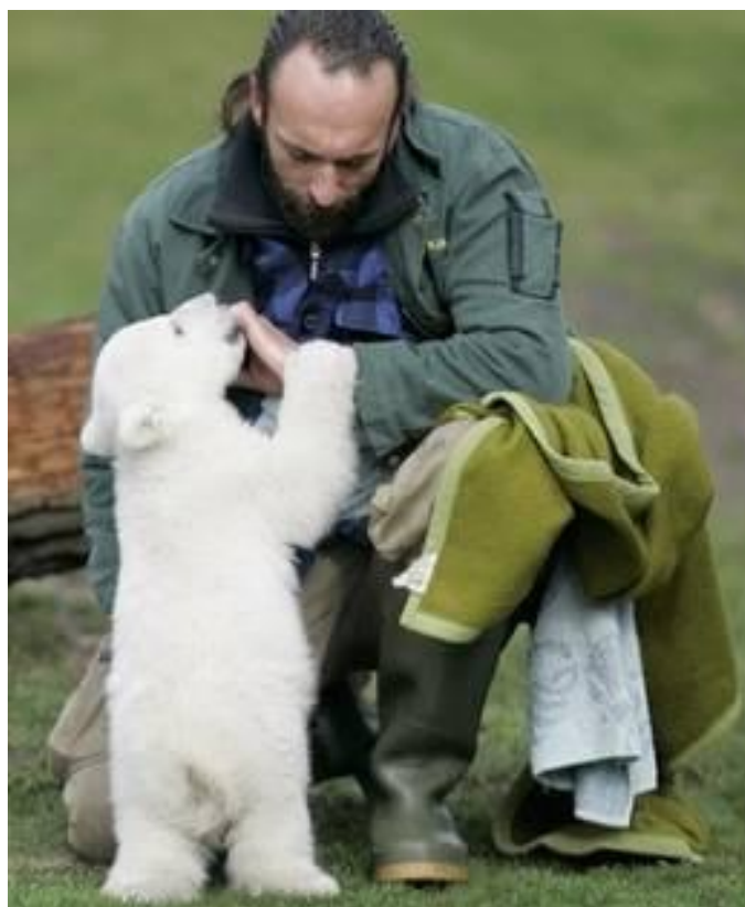
Lední medvídě Knut s tatínkem