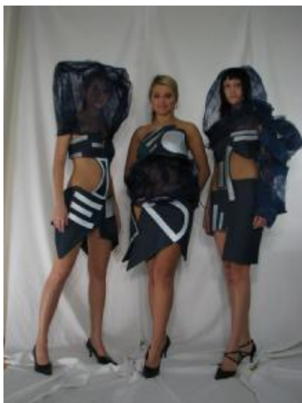
MarRI (S. E.)

Přehlídka byla velice podařená a možná, že některé z našich spolužaček také už o této škole uvažují, tak je možná za pár let na molu uvidíme:).