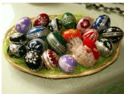
Hanácké kraslice, zdobené slámou.