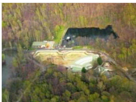
letecký pohled na pavilon slonů