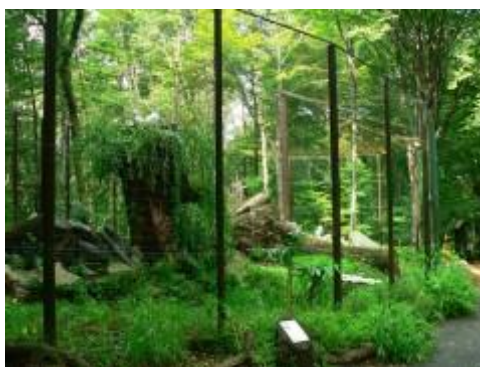
voliéry severských sov