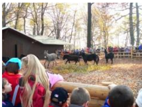
stáje pro poníky a oslíky

Určitě všichni známe Zoo Ostrava.. Tato zoo se u nás na škole proslavila nejenom svými soutěžemi, nádhernými zvířaty, ale i ochranou přírody. Původním účelem zoologických zahrad bylo především seznámit návštěvníka s co největším počtem různých druhů zvířat a to zcela bez ohledu na jejich potřeby. Zvířata, která v přírodě žijí ve skupinách, byla často chována po jednom exempláři a všechna pak v naprosto nevyhovujících podmínkách v malých ubikacích. K významné změně došlo v poměrně nedávné době a zoo se dnes mění nejen ve významná centra odpočinku a vzdělání, ale také v místa, kde je vyvíjena snaha o záchranu zvířecích druhů, z nichž mnohé už v přírodě nežijí nebo z ní v nejbližší době vymizí. Důkazem této snahy jsou dva výchovné programy evropských zoologických zahrad známe pod zkratkou EEP a ESB (obdobný program mají také americké zoologické zahrady) a na celosvětové úrovni pak mezinárodní plemenné knihy.